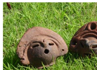
土偶 5,599 点が国の重文指定

フットパスの散策を通じて、地域の内外の皆さんに勝沼の自然や歴史文化、風土を楽しんでいただこうと「勝沼フットパスの会」では、今年もウェルカムツアーを開きます。今回のコースは縄文ロマンと盆地の眺めを楽しむ藤井、千米寺地区をめぐる。葡萄畑の紅葉が残る晩秋の一日、市民ガイドと一緒に歩いてみませんか。